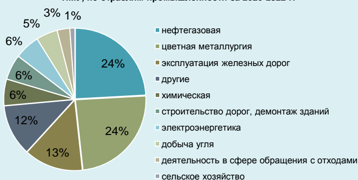
Распределение ОНВ, разрабатывающих планы мероприятий при НМУ, по отраслям промышленности за 2020-2022 гг

Всего за период 2020-2022 г. зафиксировано 137 отказов в согласовании планов. Наибольшее число отказов в согласовании, как и заявлений, наблюдалось в 2021 году. Причиной отказа является тот факт, что мероприятия при НМУ не обеспечивают снижение создаваемых выбросами источников ОНВ приземных концентраций загрязняющих веществ.