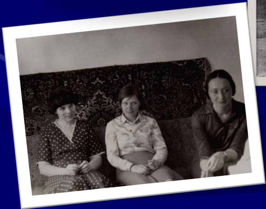
После защиты диплома. 1979 год