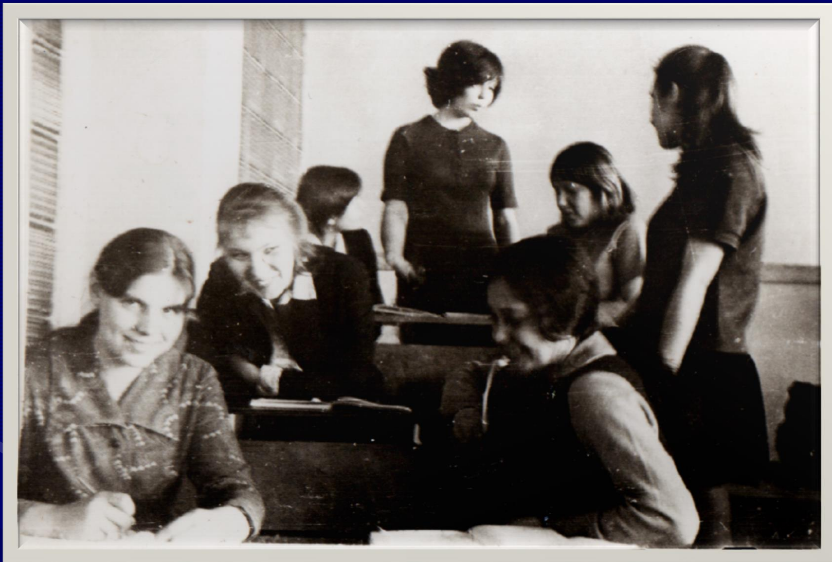
1 курс, девушки