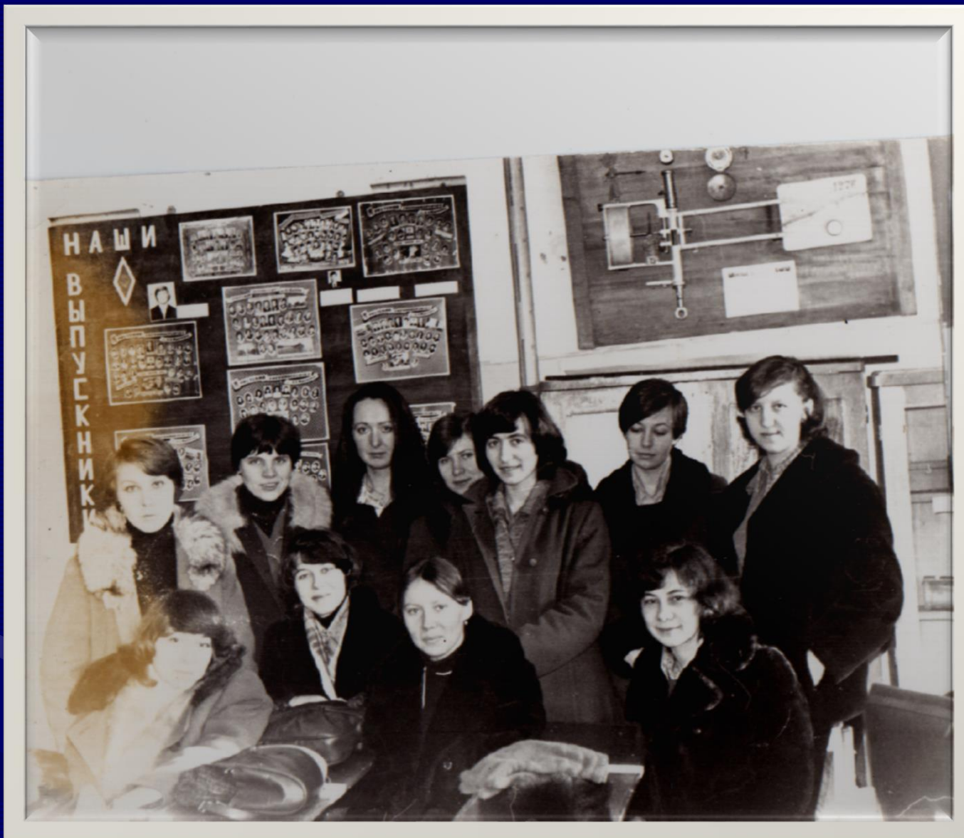
5 курс .