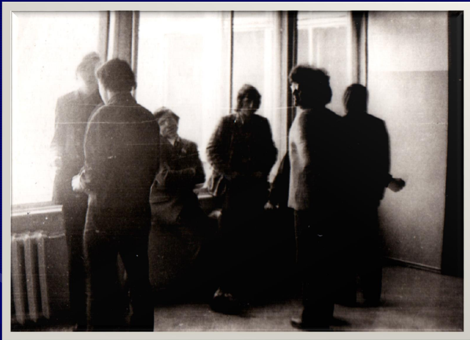
1 курс, юноши